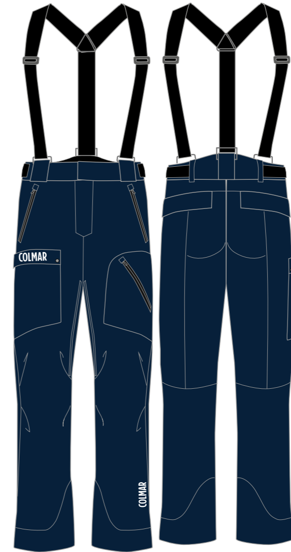
MU1635 - MB4609 - MD2633_5NX_68U

"SIGNING THIS DOCUMENT THE CUSTOMER ACCEPT UNRESERVEDLY THE WHOLE GRAPHIC PROPOSAL THAT WILL BE ON THE GARMENTS AND IN PARTICULAR LOGO, SIZE, PLACEMENT AND COLORS."