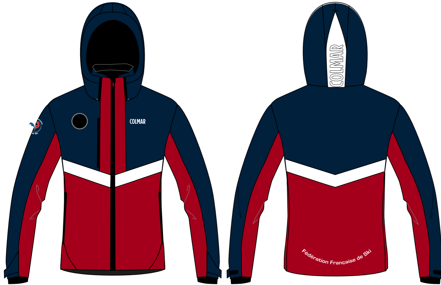
B1572 - B4515 - B2554_5NX_42H